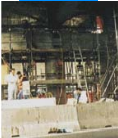
Вид моста во время ремонтных работ

строительстве без использования специальных машин и оборудования, экономит время и зачастую может накладываться на конструкцию без задержек в основном процессе строительства. В отличие от методики покрытия конструкций металлическими листами (плакирование бетона) процесс наложения пластин Carboplate не требует устройства временного усиления конструкции на период наложения, тем самым устраняя риск коррозионного повреждения накладываемых усиливающих конструкций. Пластины Carboplate быстро и легко устанавливаются на месте строительства. Благодаря их высокой гибкости пластины Carboplate пригодны для покрытия цилиндрических поверхностей структур (днищ бассейнов, резервуаров и т.п.) с радиусом кривизны более 3 м.