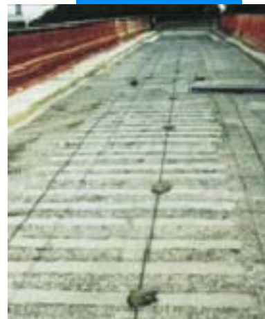
Пластины Carboplate, покрытые составом Maregrout BM

Хотя технические характеристики и рекомендации, приведенные в данном описании продукции, соответствуют нашим собственным знаниям и опыту, всю вышеприведенную информацию необходимо в любом случае рассматривать исключительно как общее руководство, нуждающееся в проверке посредством долгосрочного практического применения. Поэтому перед использованием данной продукции необходимо убедиться, что она подходит для планируемого варианта использования. В любом случае пользователь несет полную ответственность за любые возможные последствия, связанные с использованием данной продукции.