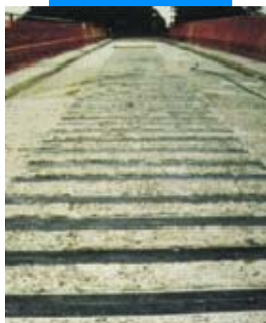
Мостовой настил, усиленный пластинами Carboplate